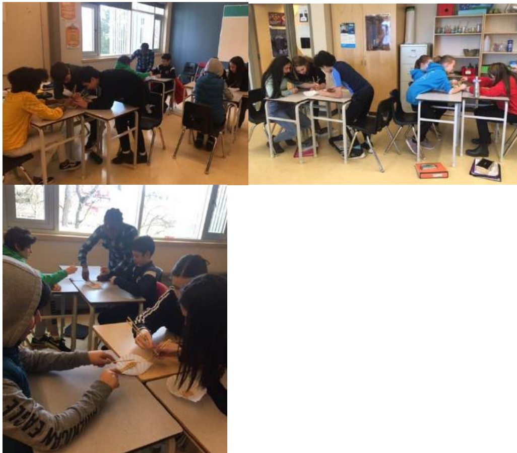
Même expérience avec les 7C...