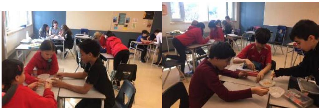
Expérience "pinçons de Darwin" pour démontrer la sélection naturelle:)

ET voici un petit clin d'œil de l'info Jules-Verne que je m'apprêtais à envoyer le 13 mars dernier :