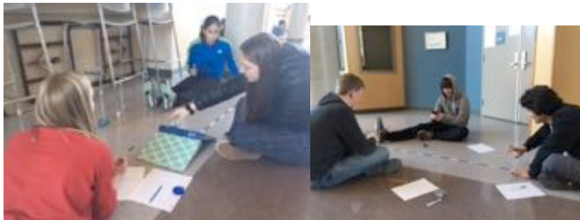
Physique 11- photo d'exercice sur la vitesse...)