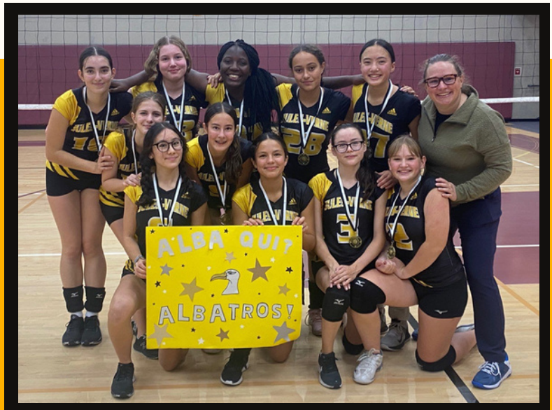
Les filles junior ont remporté le tournoi Dig it! de l'école St-John's le weekend dernier. Félicitations!

Victoires contre Fraser Academy et St-John's