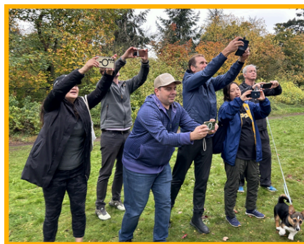
Merci à tous les parents qui se déplacent pour encourager les élèves! Sur cette photo, les parents de l'équipe JR et SR de cross-country en action!