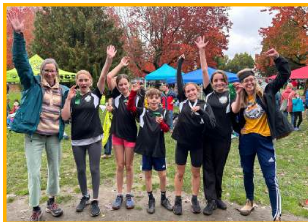
L'équipe de cross-country 7e année lors des finales à Trout Lake.